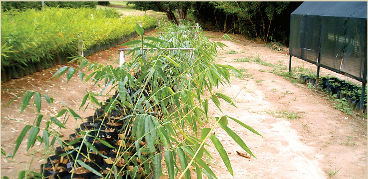
SÍTIO DA MARTA BAMBUS

Segundo as previsões, o núcleo deverá ser formado nos próximos dois meses. No momento, o secretário conversa também com autoridades do governo estadual para a inclusão do bambu como matéria-prima para biomassa na produção de energia. "A região está no centro das atividades relacionadas à crise hídrica, nas áreas do Rio Atibaia e outros nas proximidades que foram degradados. O bambu pode recompor a mata ciliar de modo a recuperar a área. A lei de 2011 é uma reivindicação do setor. Por isso, participaremos e incentivaremos essas atividades com a Prefeitura de Atibaia e a Associação da Indústria de Cogeração de Energia (Cogen) na busca continuada com essas entidades para o período de entressafra, acrescentando ou estocando bagaço e outros energéticos. Não se trata de uma discussão que se faz de um dia para o outro, mas temos todo o interesse em agilizar essa condição", diz o subsecretário de Agricultura e Energia.