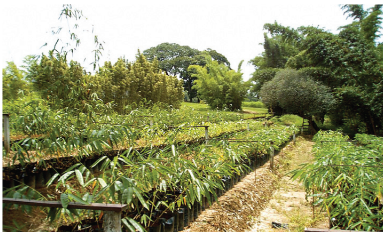
Viveiro do Sítio da Mata Bambus e algumas das espécies cultivadas: bambu imperial (1), bambu barriga de buda (2), bambu preto (3)

O viveiro da empresa tem área de 4 hectares, e o processo de produção das mudas de bambu ocorre com o uso das hastes secundárias, obtidas de um banco clonal de touceiras selecionadas em florestas plantadas pela Proflora com o gênero Bambusa vulgaris . Borges conta que o nível técnico de melhoramento foi conquistado ao longo de 25 anos de pesquisa, que ocasionaram resultados em preparo de solo, espaçamento, ciclo de corte, adubação de implantação e manutenção, tratos culturais de implantação e pós-colheita, bem como produção de mudas em viveiro.